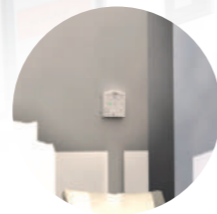
4. Télécommande radio